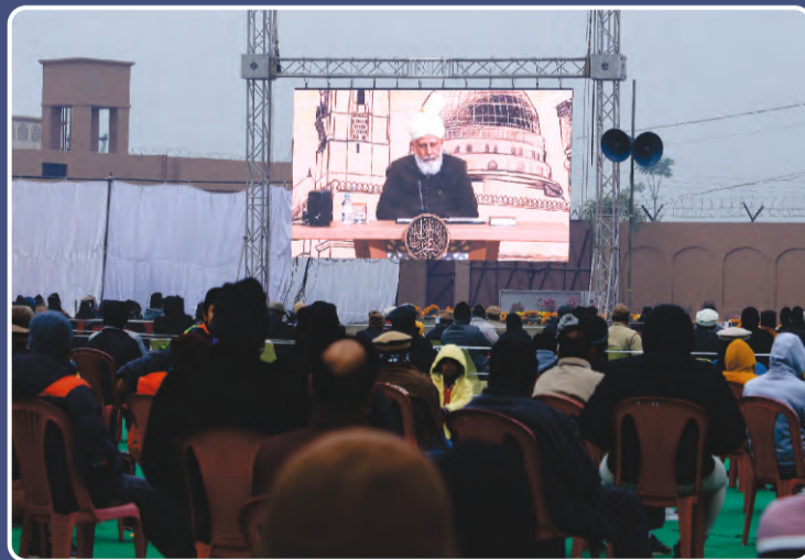
24,25,26 డిసంబర్ 2021 తేదీలో నిర్వహించబడిన జల్నా సాలానా ఖాదియాన్ యొక్క కొన్ని దృశ్యాలు.