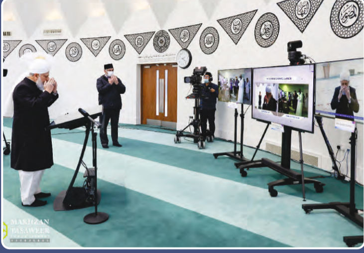
హజ్రత్ ఖలీఫతుల్ మసీహుల్ ఖామిస్ అయ్యదహుల్లాహ్ తాలా బినస్రహిల్ అజీజ్ గారు దివి: 15 జనవరి 2021న ఎం.టి.వి ఘనా యొక్క నూతన చానెల్ను ప్రారంభిస్తున్న దృశ్యం.