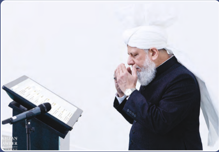
హజ్రత్ ఖలీఫతుల్ మసీహుల్ ఖామిస్ అయ్యదహుల్లాహ్ తాలా బినస్రహిల్ అజీజ్ గారు దివి: 9 ఏప్రిల్ 2021న ఖుర్ఆన్ వెబ్సైట్ను ప్రారంభిస్తున్న దృశ్యం.