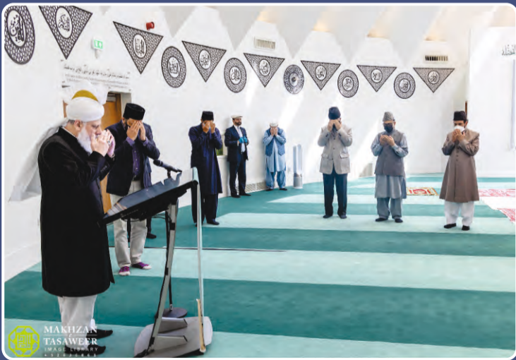
దివి: 2 జూలై 2021 న హుజూర్ అన్వార్ అహ్మది పీడియా వెబ్సైట్ను ప్రారంభిస్తున్న దృశ్యం.