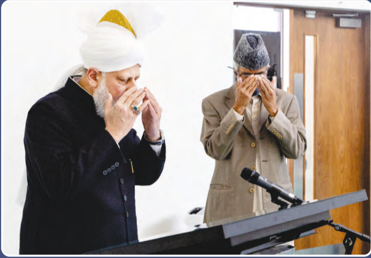
హజ్రత్ ఖలీఫతుల్ మసీహుల్ ఖామిస్ అయ్యదహుల్లాహ్ తాలా బినస్రహిల్ అజీజ్ గారు దివి:2 ఏప్రిల్ 2021న చైనా భాషలో అహ్మదియ్య జమాఅత్ నూతన వెబ్సైట్ను ప్రారంభిస్తున్న దృశ్యం.