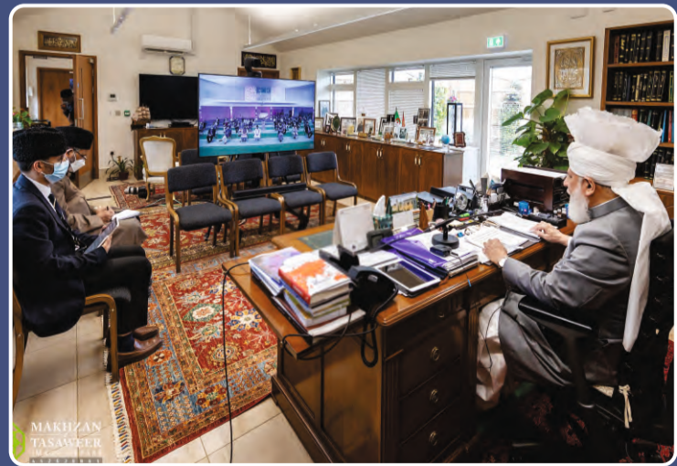
దివి: 27 జూన్ 2021న హుజూర్ అన్వార్ ఎం.టి.వి ఇంటర్నేషనల్ ద్వారా ఆన్లైన్ కాన్ఫరెన్స్ను ఉద్దేశిస్తూ ప్రసంగిస్తున్న దృశ్యం.