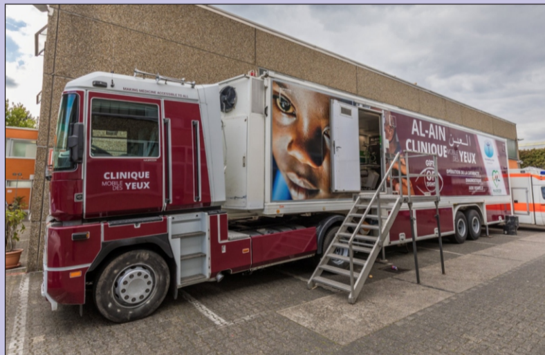
ஜெர்மனியிலுள்ள அஹ்மதிய்யா முஸ்லிம் ஜமாஅத் சார்பாக ஆப்ரிக்காவில் கண் சிகிச்சைக்கான அல்-அயன் மொபைல் கிளினிக்