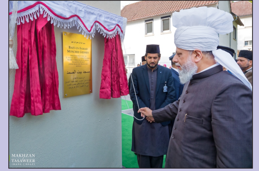
ஜெர்மனியிலுள்ள கீஸன் நகரத்திலுள்ள 21 ஆகஸ்டு 2017 அன்று மஸ்ஜிதுஸ் ஸமது திறப்பு விழாவின் படங்கள்