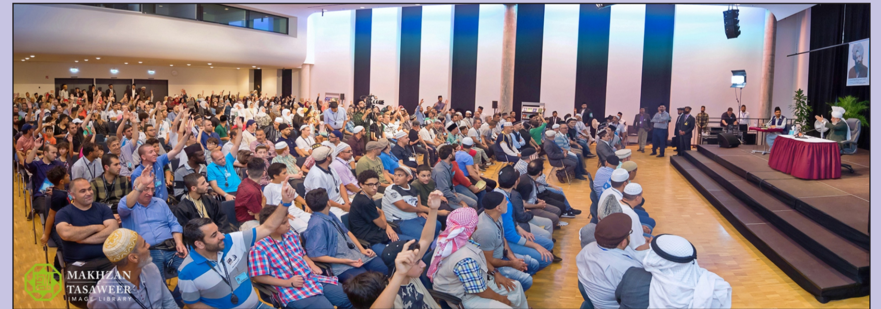
ஜெர்மனி ஆண்டு மாநாடு 2017-ன் சில அழகிய காட்சிகள்