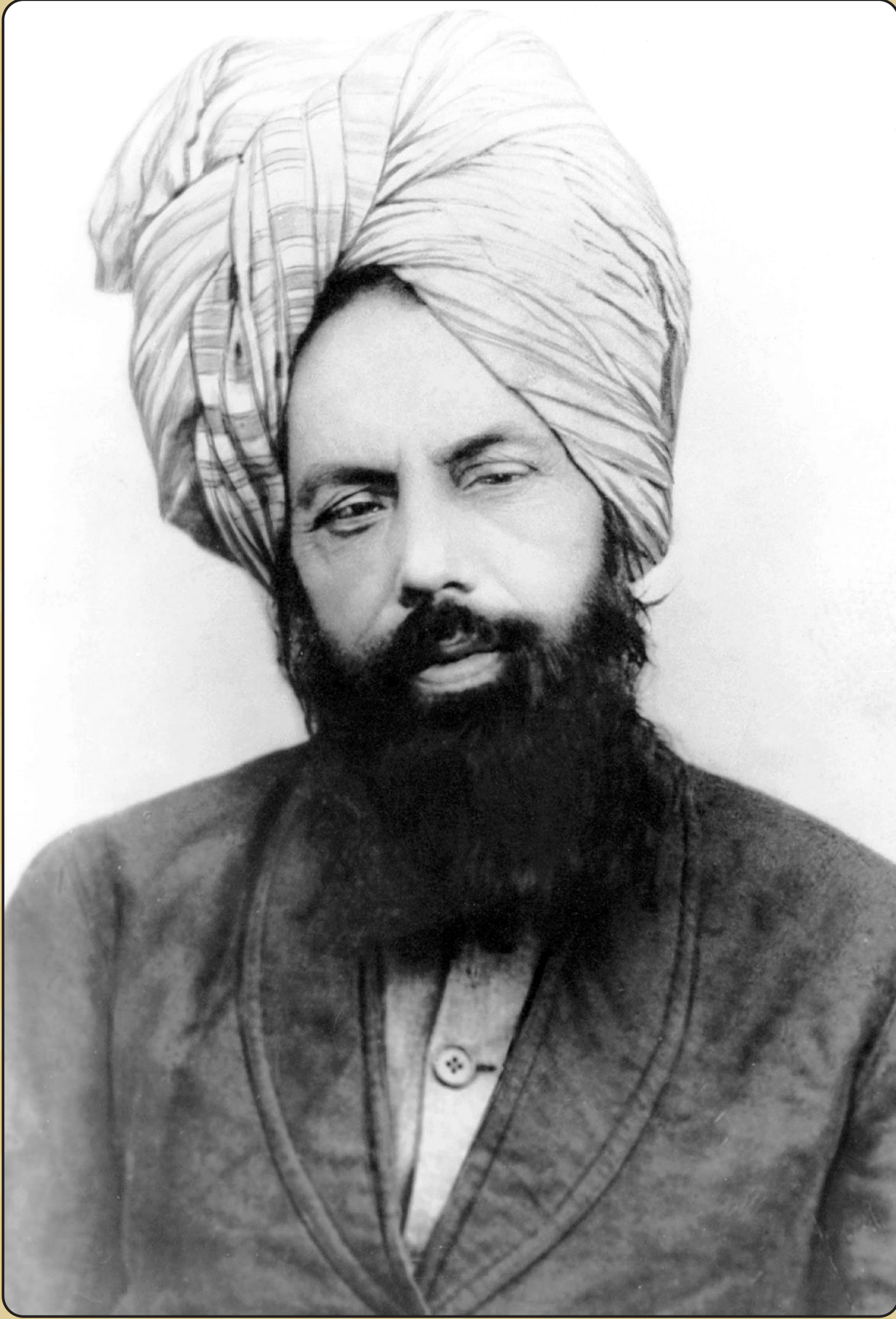
ஹஸ்ரத் மிர்ஸா குலாம் அஹ்மது காதியானி வாக்களிக்கப்பட்ட மஸ்ஹ் மற்றும் உறுதிமொழி வழங்கப்பட்ட மஹ்தி