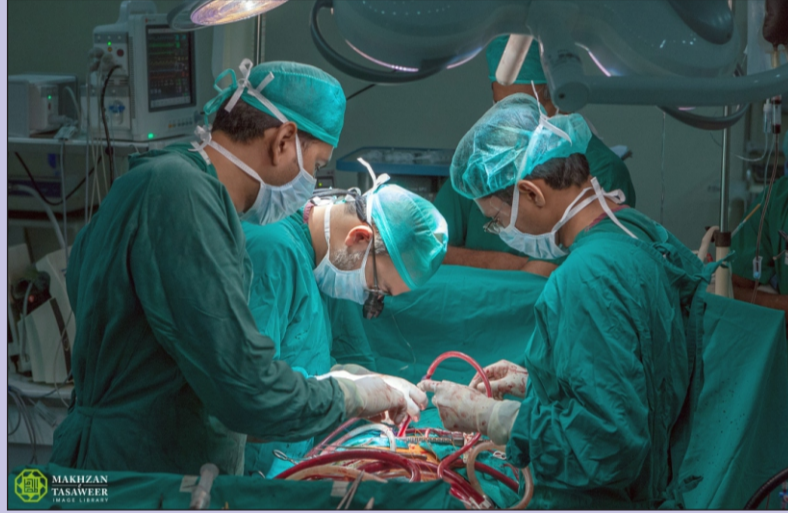
Tahir Heart Institute ரப்வா - பாகிஸ்தான்