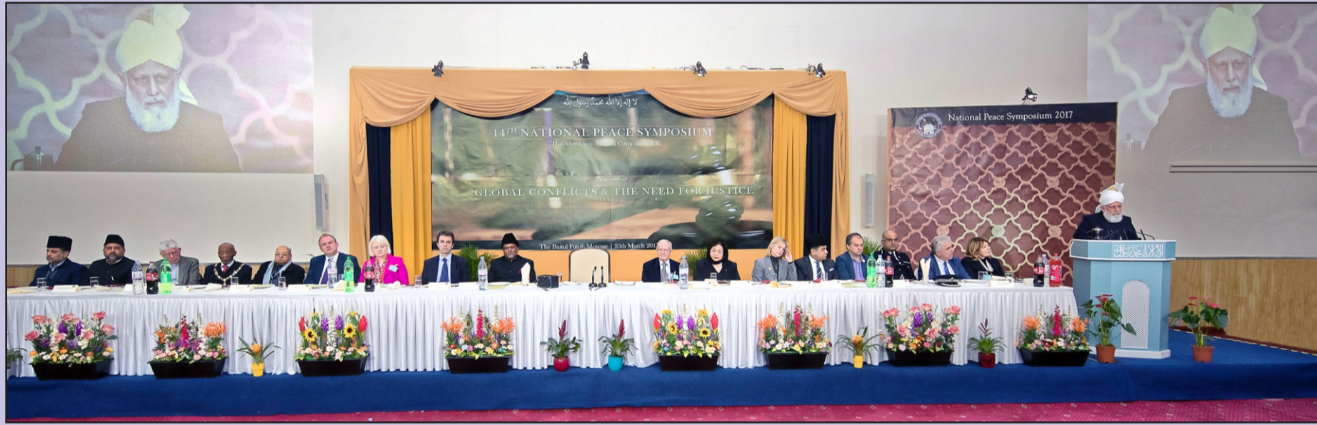
பிரித்தானியாவின் 14-வது தேசிய அமைதி கருத்தரங்கு 2017-ன் மேடையில் ஹஸ்ரத் ஜந்தாவது கலீஃபத்துல் மஸ்ஹி அவர்கள் சொற்பொழிவு ஆற்றும் காட்சி