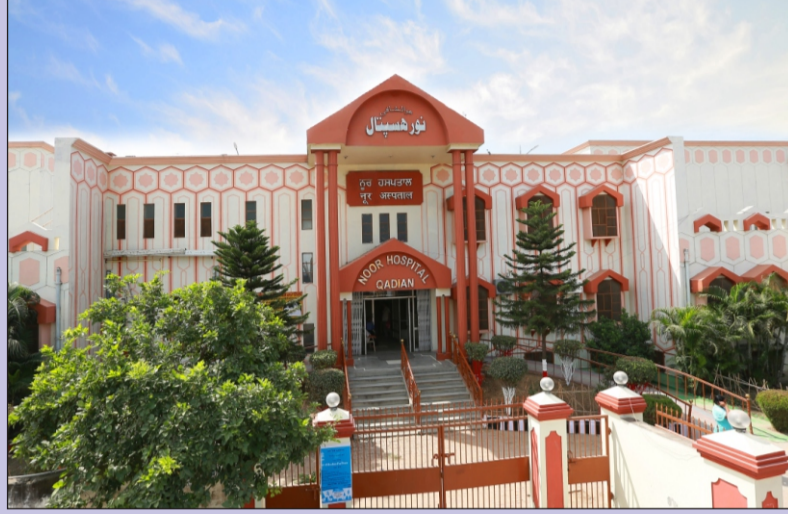
நூர் மருத்துவமனை - காதியான்

உலக முழுவதிலும் உலகளாவிய அஹ்மதிய்யா முஸ்லிம் ஜமாஅத் சார்பாக செய்யப்படும் மனிதகுல தொண்டு தொடர்பான சில காட்சிகள்