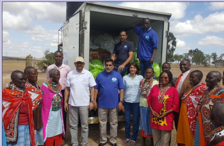
Humanity First சார்பாக நிவாரணம் வழங்கும் காட்சி