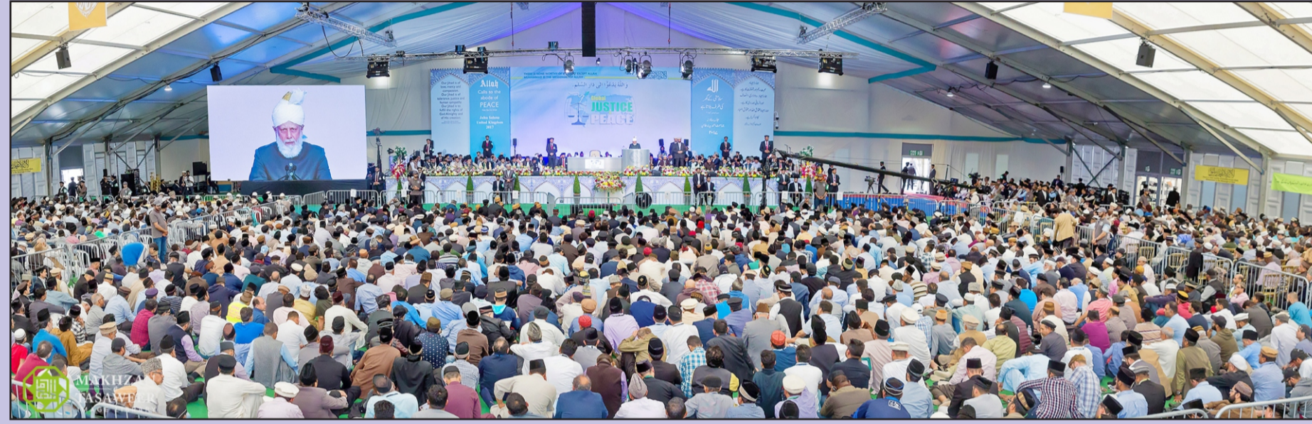
பிரித்தானியா ஆண்டு மாநாடு 2017-ன் சில அழகிய காட்சிகள்