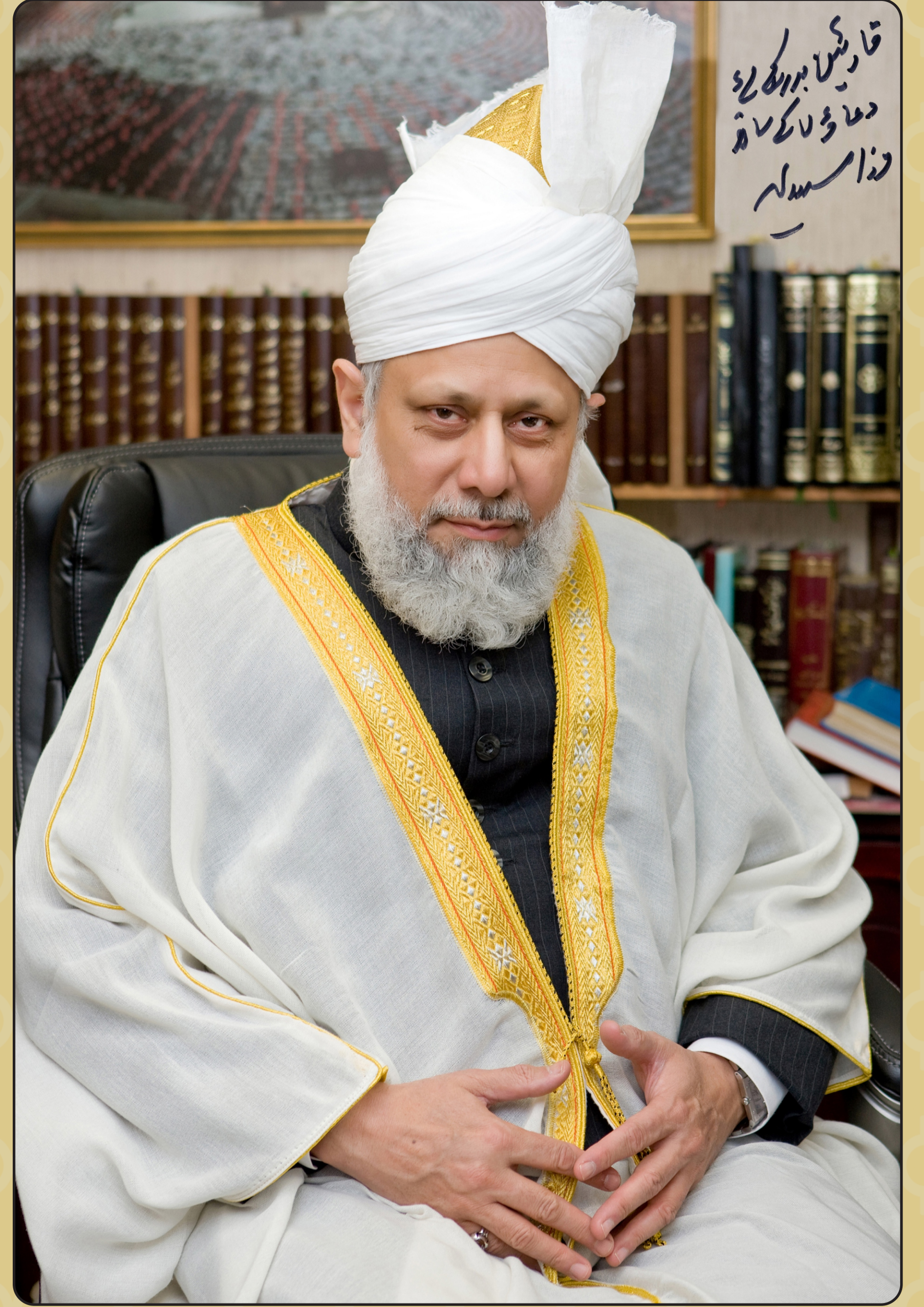
அமைதி, அன்பின் தூதுவர் ஐந்தாவது கல்ஃபத்துல் மஸ்ஹ் ஹஸ்ரத் மிர்ஸா மஸ்ரூர் அஹ்மது (அப்யதஹுல்லாஹுத் தஆலா...)