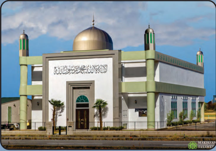
मस्जिद बैतुल अहद (नगोया, जापान)