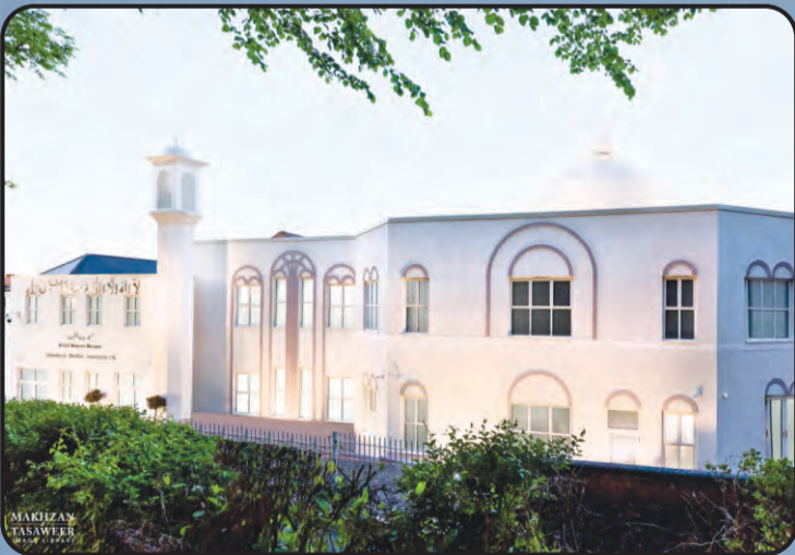
मस्जिद बैतुल मुकीत (वल्साल, यू.के.)