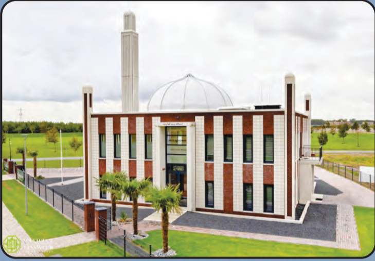
बैतुल आफ्रियत (अल्मीरे, हालैंड)