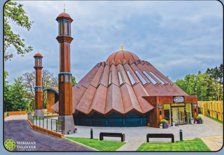
मस्जिद मुबारक (इस्लामाबाद, यू.के.)