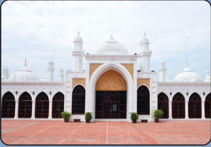
मस्जिद अक्सा (क्रादियान)