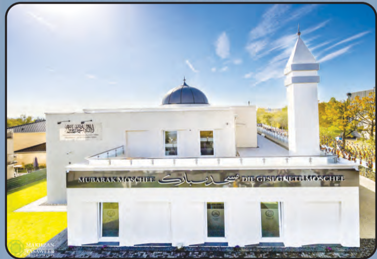
मस्जिद मुबारक (वॉज़बादिन, जर्मनी)

विश्वव्यापी जमाअत अहमदिया संसार के 213 देशों में स्थापित हो चुकी है अल्हम्दुलिल्लाह। संसार के विभिन्न देशों में जमाअत अहमदिया की ओर से बनने वाली मस्जिदों के सुंदर चित्र