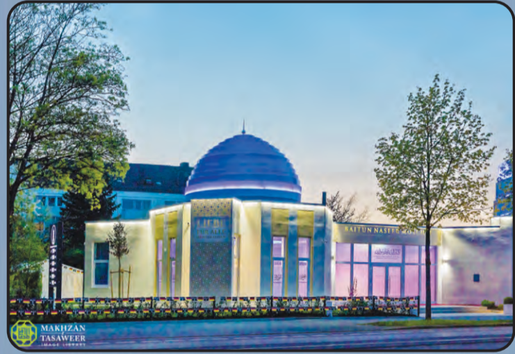
मस्जिद बैतुल नसीर (आगसबर्ग, जर्मनी)