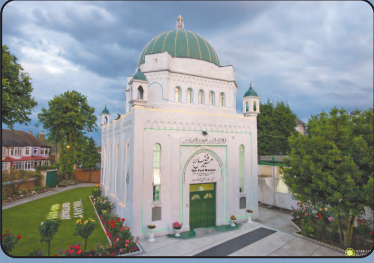
मस्जिद फ़ज़ल (लंदन, यू.के.)