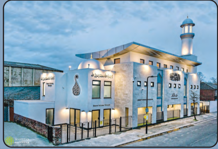
मस्जिद दारुस्सलाम (साऊथ हाल यू.के.)