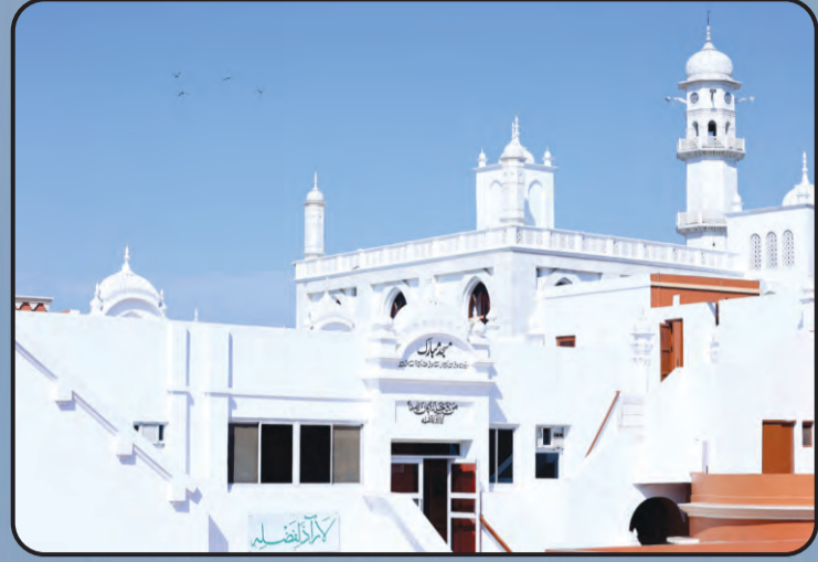
मस्जिद मुबारक (क्रादियान)