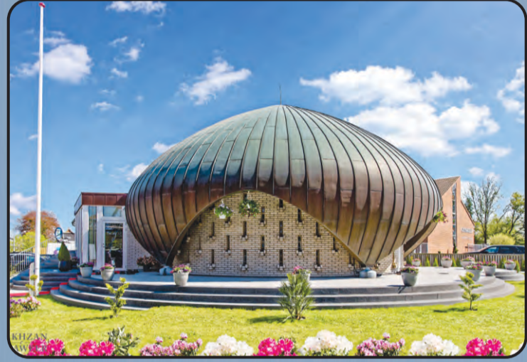
मस्जिद नुसरतजहाँ (कोपेनहेगन, डेनमार्क)