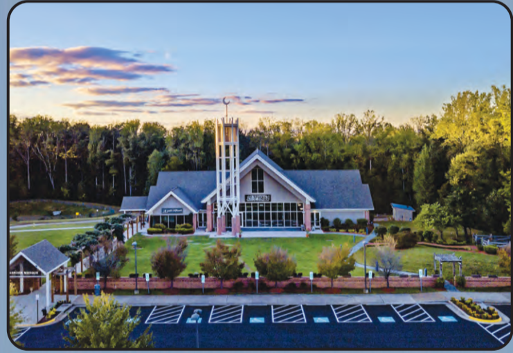
मस्जिद मसरूर (वर्जीनिया, अमरीका)