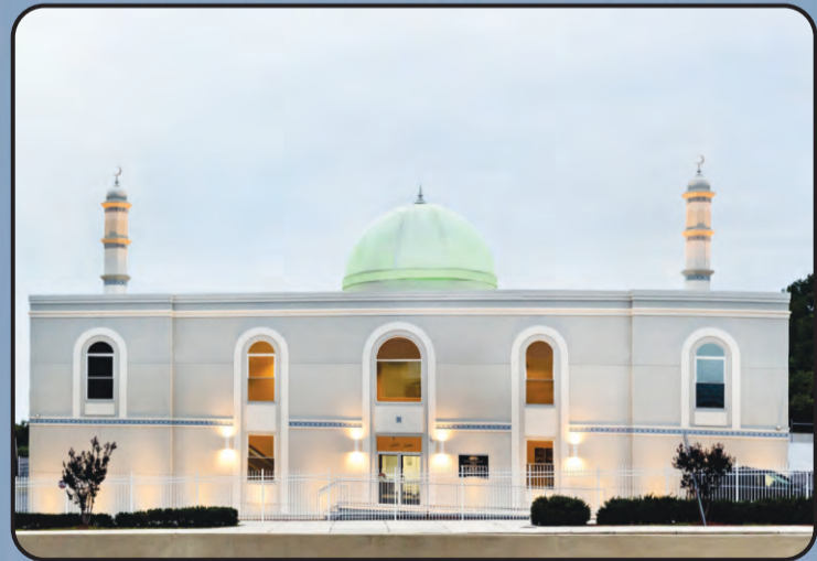
मस्जिद बैतुल समद (बाल्टीमोर, अमरीका)

विश्वव्यापी जमाअत अहमदिया संसार के 213 देशों में स्थापित हो चुकी है अल्हम्दुलिल्लाह। संसार के विभिन्न देशों में जमाअत अहमदिया की ओर से बनने वाली मस्जिदों के सुंदर चित्र