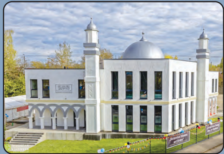
மஸ்ஜித் பைத்துல் ஹமீது (ஜெர்மனி)

உலகளாவிய அஹ்மதிய்யா ஜமாஅத் இன்று உலகில் 213 நாடுகளில் நிலைபெற்றிருக்கிறது. அல்ஹம்துலில்லாஹ். உலகின் பல்வேறு நாடுகளில் அஹ்மதிய்யா ஜமாஅத் சார்பாக கட்டப்பட்டுள்ள சில பள்ளிவாசல்களின் அழகிய நிழற்படங்கள்