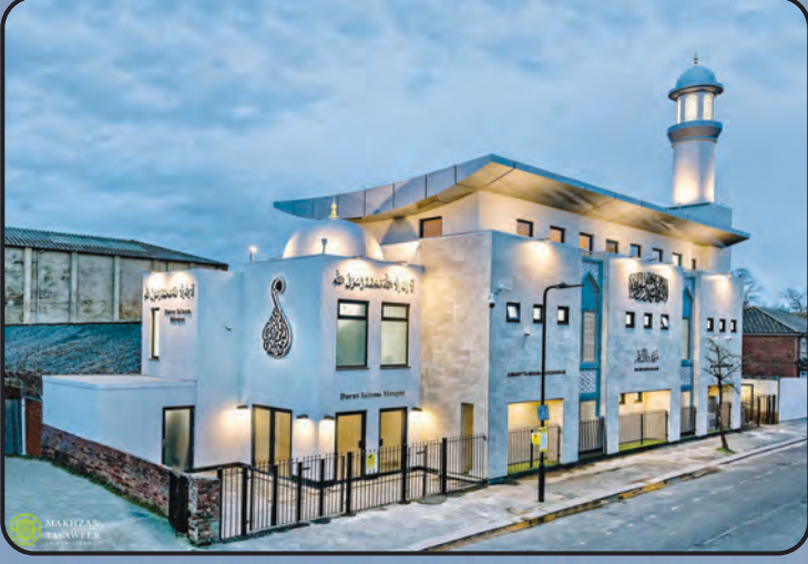
மஸ்ஜித் தாருஸ் ஸலாம் (U.K)