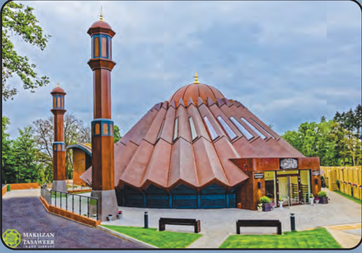
மஸ்ஜித் முபாரக் (இஸ்லாமாபாத், U.K)