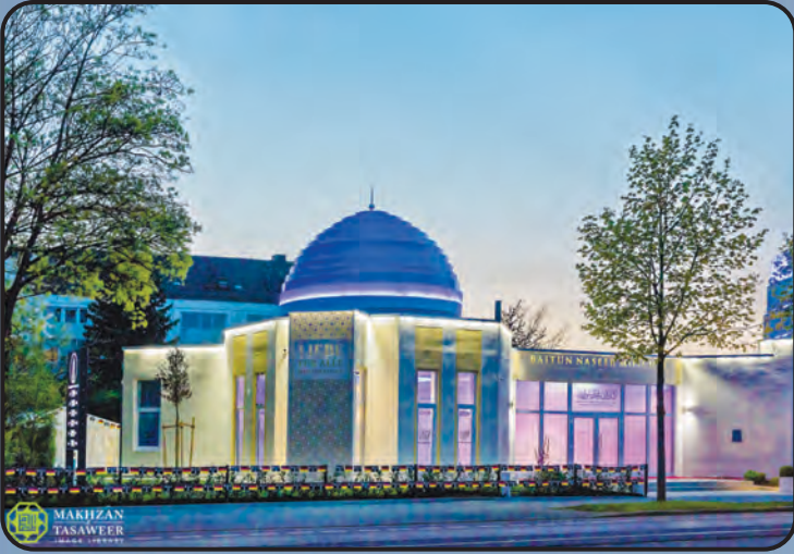
மஸ்ஜித் பைத்துன் நூர் (ஜெர்மனி)