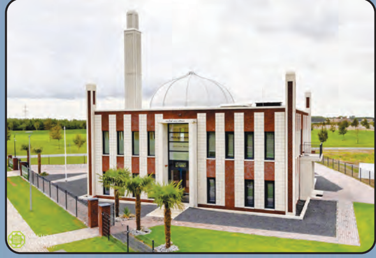
பைத்துல் ஆஃபியா (ஹாலந்து)