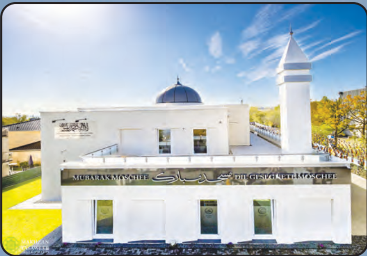
மஸ்ஜித் முபாரக் (ஜெர்மனி)