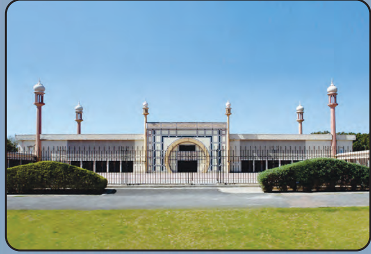
மஸ்ஜித் அக்ஸா (ரப்வா, பாகிஸ்தான்)