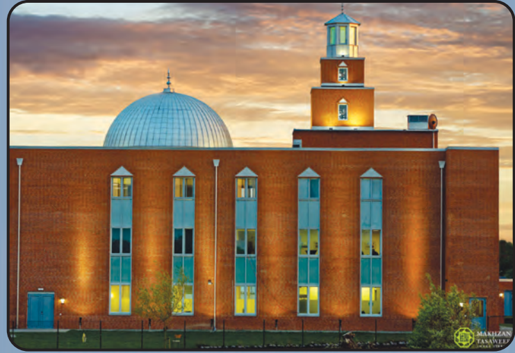
மஸ்ஜித் மஹ்முத் (சுவீடன்)