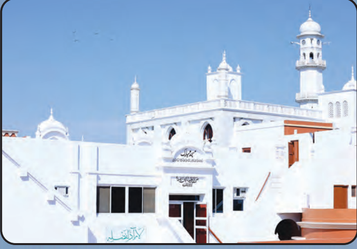
மஸ்ஜித் முபாரக் (காதியான்)