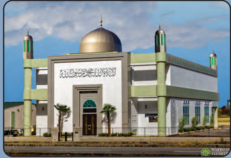
மஸ்ஜித் பைத்துல் அஹது (ஜப்பான்)