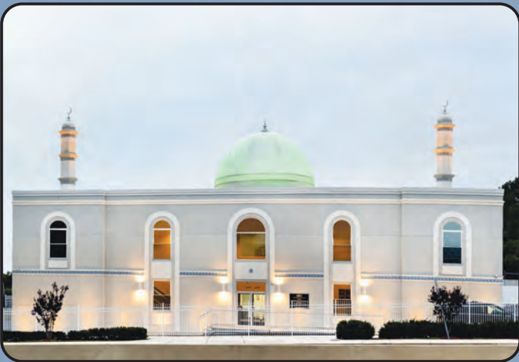
மஸ்ஜித் பைத்துஸ் ஸமது (அமெரிக்கா)