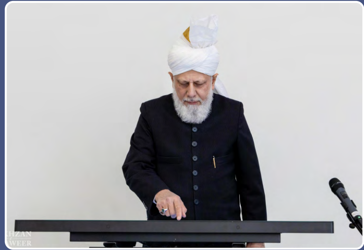
ହଜରତ ଖଲିଫତୁଲ ମସିହ ପଞ୍ଚମ ଶ 2 ଅପ୍ରେଲ 2021 ଦିନ ଚାଇନିଜ ଭାଷାରେ ଜମାଅତ ଅହମଦୀୟାର ନୂତନ ଝେବସାଇଟ ଲଞ୍ଚ କରୁଛନ୍ତି