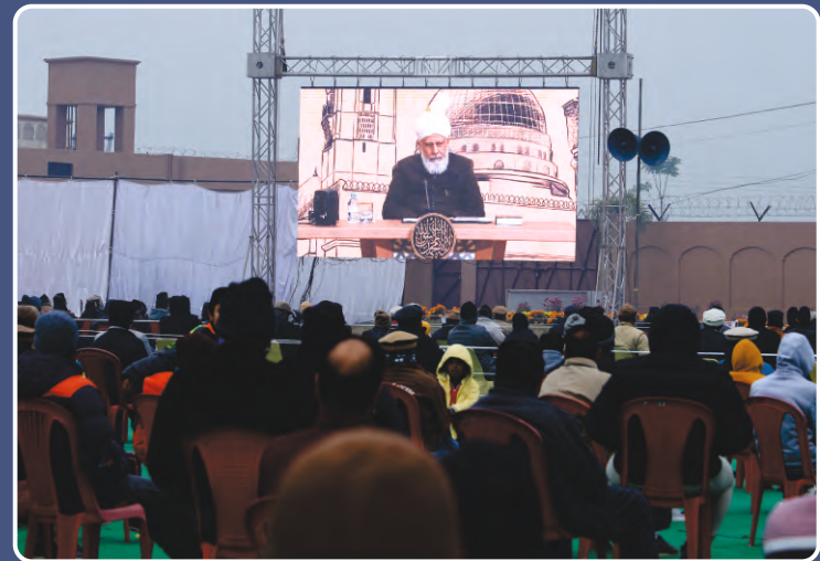
24,25, 26 ଡିସେମ୍ବର 2021 ରେ ଅନୁଷ୍ଠିତ ଜଲସା ସାଲାନା କାଦିୟାନର କେତେକ ମନୋରମ ଦୃଶ୍ୟ