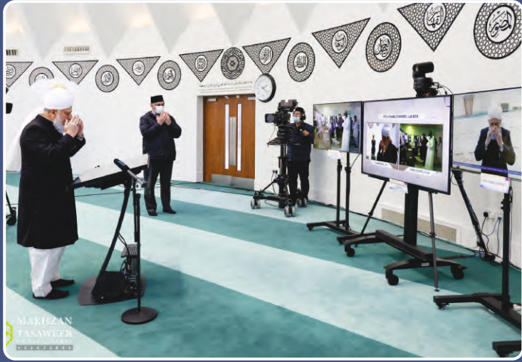
ହଜରତ ଖଲିଫତୁଲ ମସିହ ପଞ୍ଚମ ଶ 15 ଜାନୁୟାରୀ 2021 ଦିନ MTA ଘାମା ସକାଶେ ଚାନ୍ଦେଲ ଉନ୍ନୋତନ କରୁଛନ୍ତି