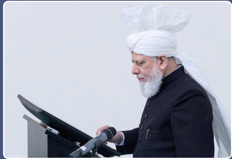
9 ଅପ୍ରେଲ 2021 ଦିନ ହଜରତ ଖଲିଫତୁଲ ମସିହ ପଞ୍ଚମ ଶ କୁରଆନ ଝେବସାଇଟ ଉଦଘାଟନ କରୁଛନ୍ତି