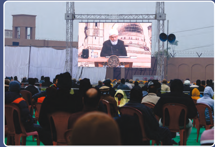
ದಿನಾಂಕ 24,25,26 ಡಿಸೆಂಬರ್ 2021ರಲ್ಲಿ ಆಯೋಜಿಸಲಾದ ಜಲ್ಲ ಸಾಲಾನ ಖಾದಿಯಾನ್‌ನ ಕೆಲವು ಸುಂದರ ನೋಟಗಳು