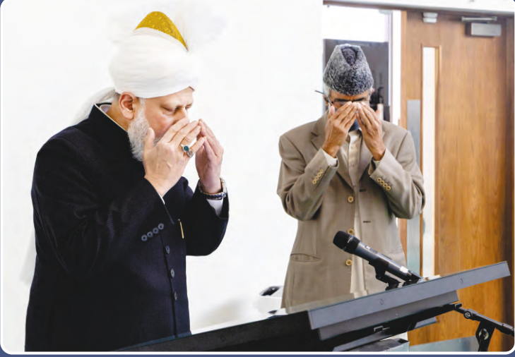
ಅಹ್ಮದಿಯಾ ಮುಸ್ಲಿಮ್ ಜಮಾಅತ್‌ನ ಐದನೇ ಖಲೀಫಾ ಹರ್ಯಾತ್ ಮಿರ್ಜಾ ಮಸ್ರೂರ್ ಅಹ್ಮದ್ (ರಹಮತ) ರವರು ದಿನಾಂಕ 02 ಏಪ್ರಿಲ್ 2021ರಂದು ಚೈನಿಸ್ ಭಾಷೆಯಲ್ಲಿ ಅಹ್ಮದಿಯಾ ಜಮಾಅತ್ತಿನ ಹೊಸ ವೆಬ್‌ಸೈಟ್‌ನ್ನು ಉದ್ಘಾಟಿಸುತ್ತಿರುವುದು