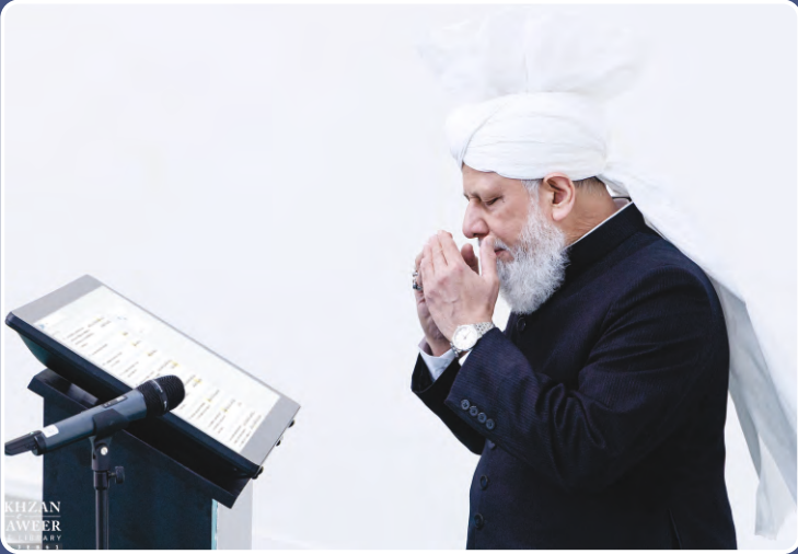
ಅಹ್ಮದಿಯಾ ಮುಸ್ಲಿಮ್ ಜಮಾಅತ್‌ನ ಐದನೇ ಖಲೀಫಾ ಹರ್ಯಾತ್ ಮಿರ್ಜಾ ಮಸ್ರೂರ್ ಅಹ್ಮದ್ (ರಹಮತ) ರವರು ದಿನಾಂಕ 09 ಏಪ್ರಿಲ್ 2021ರಂದು ಖುರ್ಆನ್ ವೆಬ್‌ಸೈಟ್‌ನ್ನು ಉದ್ಘಾಟಿಸುತ್ತಿರುವುದು