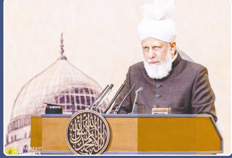
ಅಹ್ಮದಿಯಾ ಮುಸ್ಲಿಮ್ ಜಮಾಅತ್‌ನ ಐದನೇ ಖಲೀಫಾ ಹರ್ಯಾತ್ ಮಿರ್ಯಾ ಮಸೂರಾ ಅಹ್ಮದ್ (ಅತಬಲ) ರವರು ಜಲ್ಲ ಸಲಾನ ಖಾದಿಯಾನ್ 2021ರ ಸಂದರ್ಭದಲ್ಲಿ ಲಂಡನ್‌ನಿಂದ ಸಮಾರೋಪ ಸಮಾರಂಭದಲ್ಲಿ ಸಂಬೋಧನೆ ಮತ್ತು ದುಆ ನಿರ್ವಹಿಸುತ್ತ