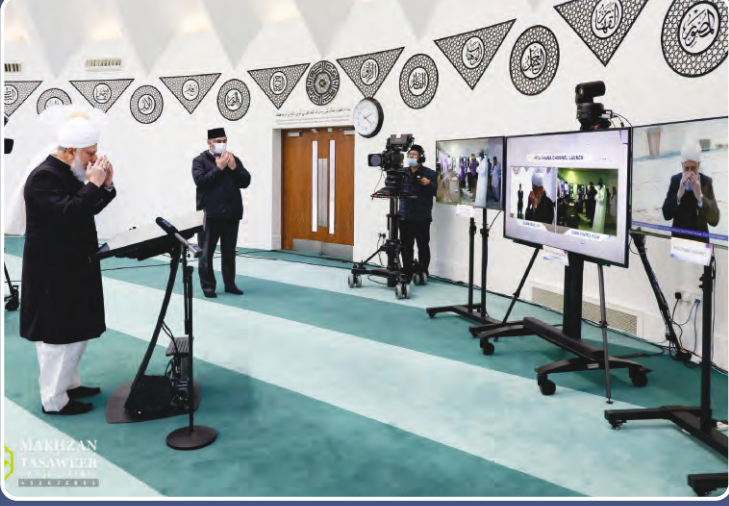
ಅಹ್ಮದಿಯಾ ಮುಸ್ಲಿಮ್ ಜಮಾಅತ್‌ನ ಐದನೇ ಖಲೀಫಾ ಹರ್ಯಾತ್ ಮಿರ್ಜಾ ಮಸ್ರೂರ್ ಅಹ್ಮದ್ (ರಹಮತ) ರವರು ದಿನಾಂಕ 15 ಜನವರಿ 2021ರಂದು MTA Ghana ದ ಹೊಸ ಚೀನಲನ್ನು ಉದ್ಘಾಟಿಸುತ್ತಿರುವುದು